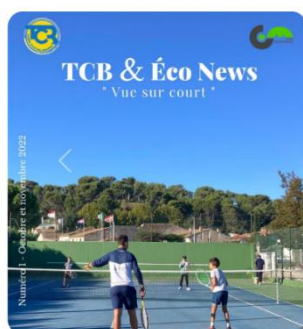
Sortie de notre Journal N°1